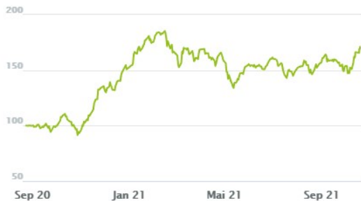
CHART SEIT ERSTELLUNGSDATUM

Das wikifolio Index Zertifikat „Renewable energy market“ wurde am 24. August 2020 erstellt. Die Erstemission erfolgte am 21. Januar 2021. Das Startkapital betrug 100.000€. Seit Erstellung des Index Zertifikates liegt die Performance bei >50% was eine überdurchschnittliche Entwicklung gegenüber Indices wie beispielsweise den DAX30, die NASDAQ100 oder den EURO STOXX50 im gleichen Zeitraum darstellt.